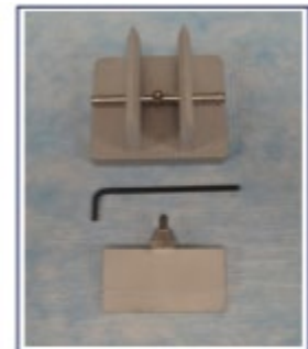
Figure 2 TA-TPB Fixture used for testing