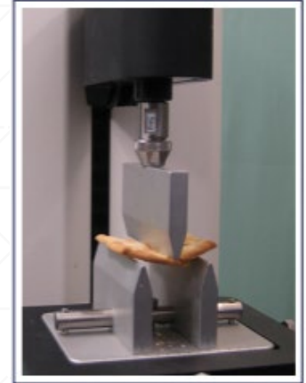
Figure 4 Sample during testing